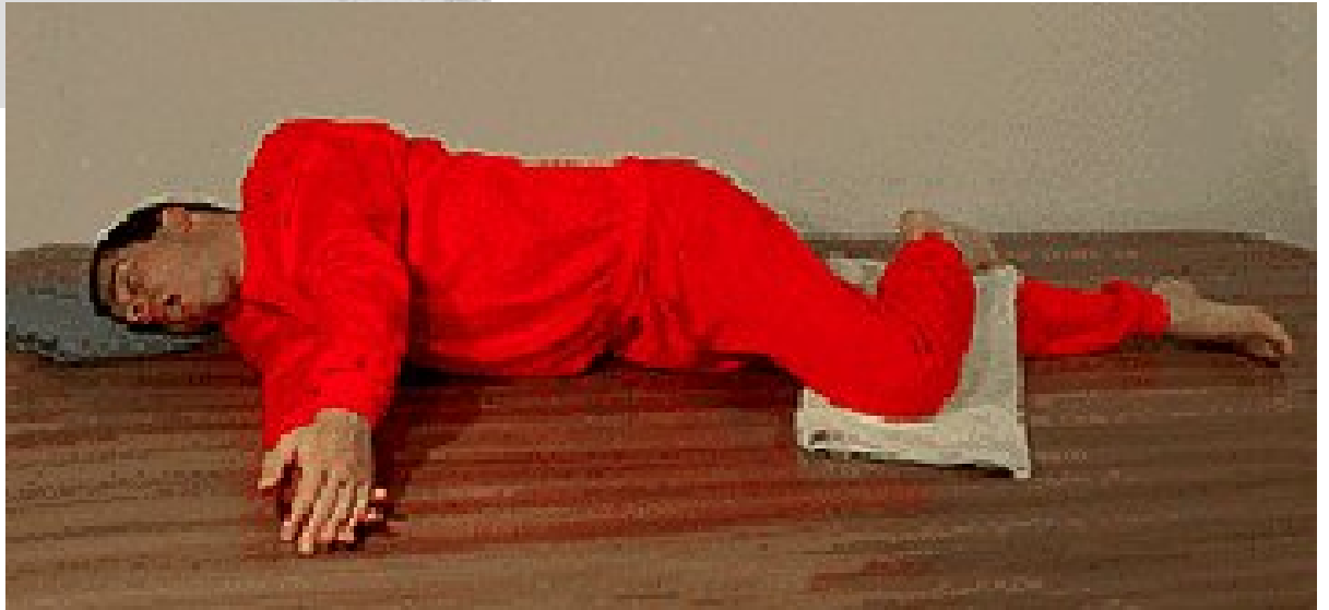
Croce Verde Lissnese

Garantisce la respirazione e una posizione stabile per andare a chiamare aiuto